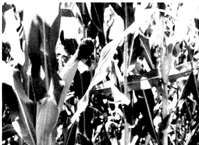
La larva della diabrotica mangia le radici, l'insetto invece si nutre solo del polline e delle barbe

La Provincia assicura: «Nessun pericolo per le persone»