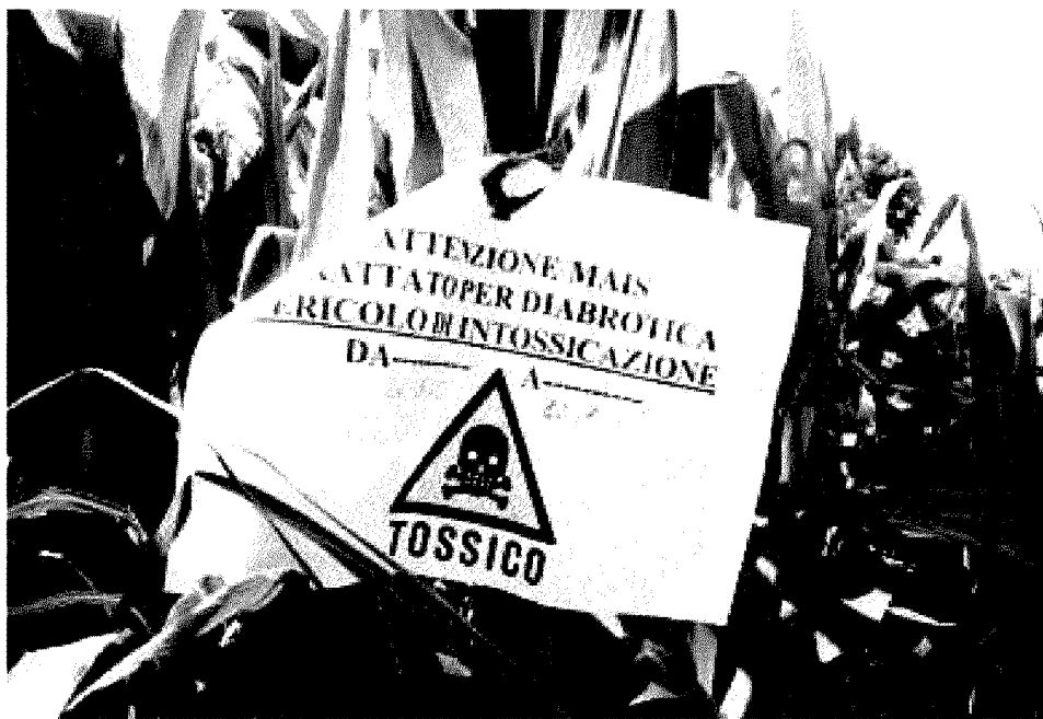
Su un campo di mais nei pressi di Brembo un cartello che invita alla prudenza nell'avvicinarsi alle aree coltivate