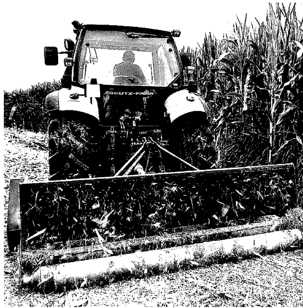
Nuovo sequestro di campi con semine di mais geneticamente modificato nelle province di Udine e Pordenone