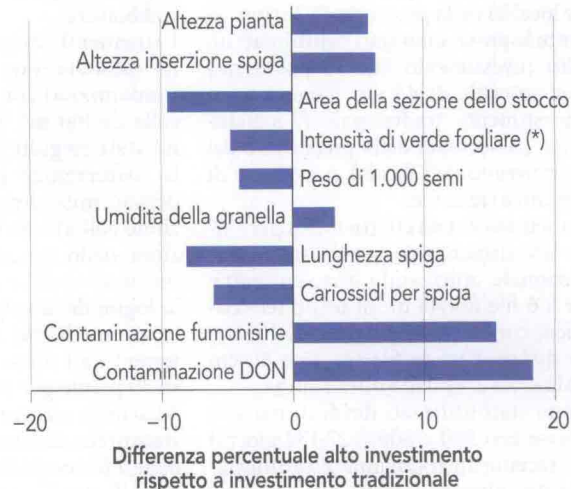
GRAFICO 2 - Alto investimento (interfila 45 cm): parametri morfologici e contenuto in micotossine a confronto rispetto a un investimento tradizionale (interfila 75 cm)

(*) Foglia della spiga alla maturazione latte.