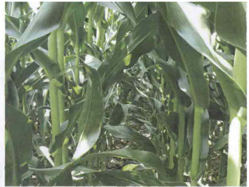
Foto 3 Con alti investimenti le esigenze colturali e gli stress diventano potenzialmente superiori, inoltre è rallentata la perdita di umidità della granella nella fase finale della maturazione.

Gli incrementi produttivi, rilevati nel biennio di confronti, confermano la notevole potenzialità degli elevati investi-