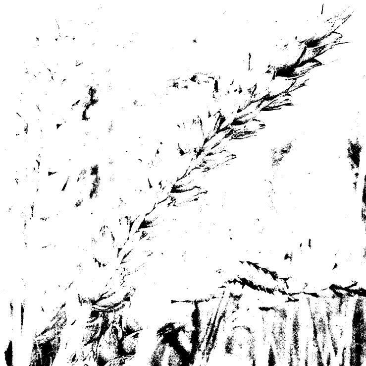
L'agricoltura non può fare a meno del contributo della ricerca